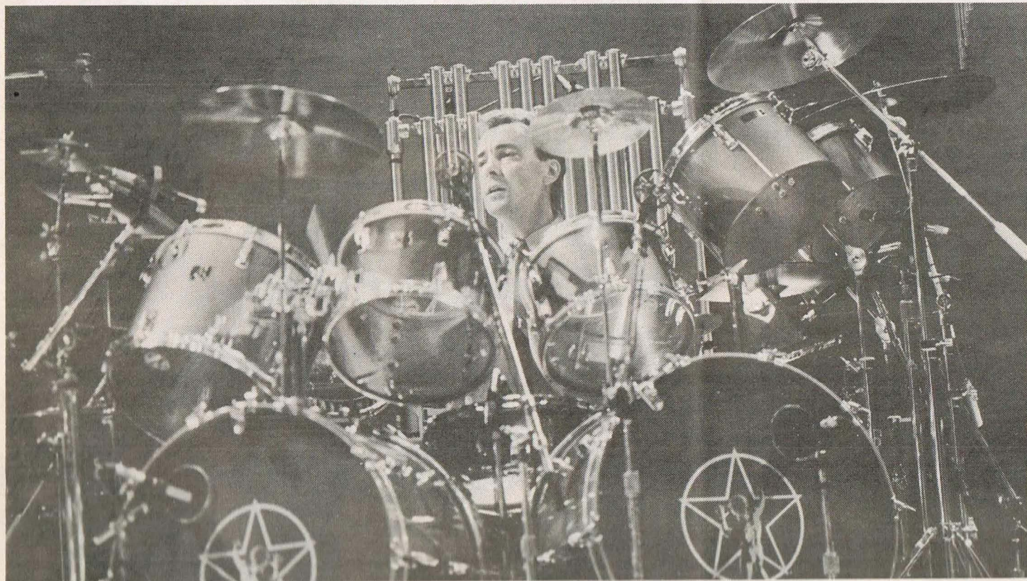
Verborgen camera versus verborgen slagwerker: 'Ik wil géén beroemd gezicht!'