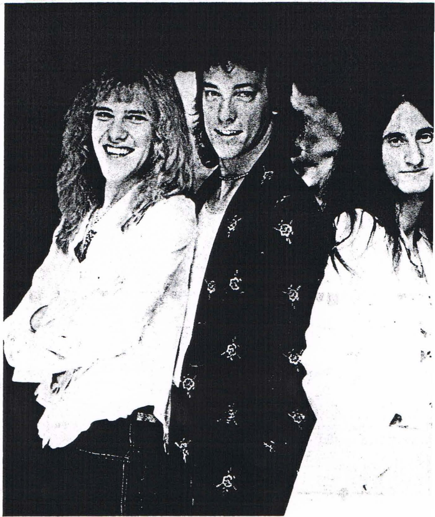
Publicité de Mercury Records pour Rush .

Visas en main, Rush partit pour les États-Unis. En deuxième, troisième (et parfois en quatrième) place à l'affiche toutes les fois qu'il se produisait avec d'autres groupes de musique métallique en tournée américaine, Rush demeura imperturbable et continua de faire ce qu'il avait toujours fait: la musique sortait, les jeunes se levaient pour ne rien perdre, ça roulait.